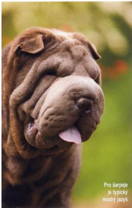
Pro šarpeje je typický modrý jazyk