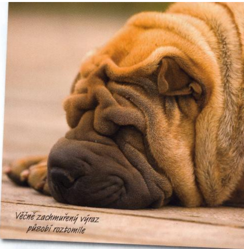
Věčně zachmuřený výraz působí roztomile