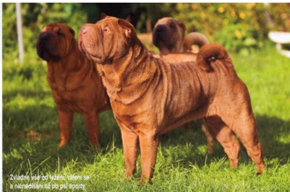
Zvládne vše od ležení, válení se a nicnedělání až po psi sporty

Plánujete-li si přivést domů šarpeje, pak počítejte s tím, že miluje pohodlí. Mnohem lépe mu vyhovuje život v bytě než venku v kotci. Důležité pro něj je,