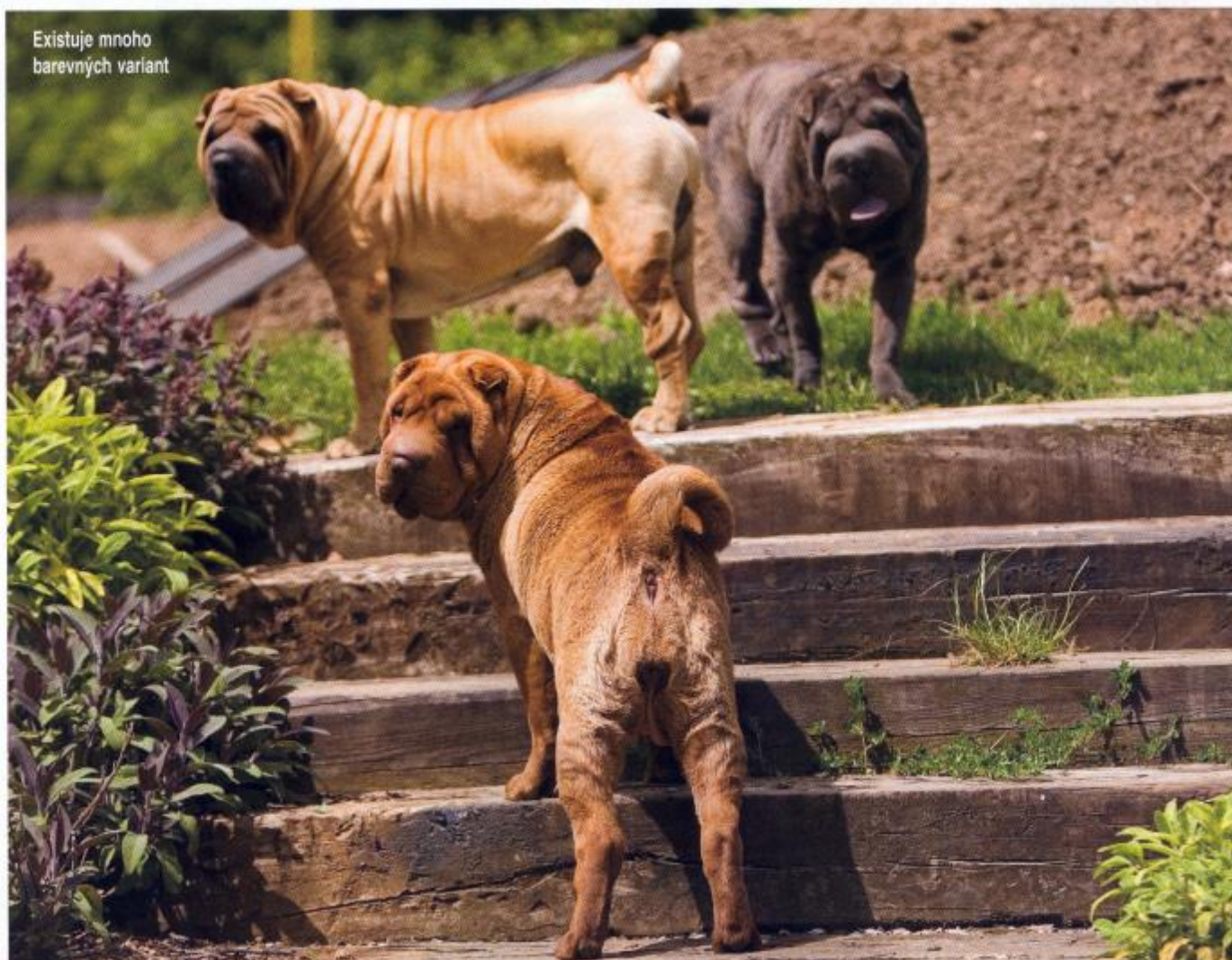
Existuje mnoho barevných variant

Zobechňovat jeho temperament je těžké, protože tak jako u jiných psů i u šarpeje platí: co kus, to originál. Obvykle je to odměřený, důstojný a velmi nezávislý pes, který se hned tak nekamarádí s cizími lidmi, nicméně někteří šarpejové jsou velmi přátelští ke každému. Je to milující a rodině velmi